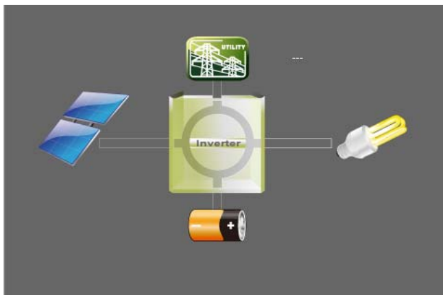
Imagen superior: Gráfico software de gestión