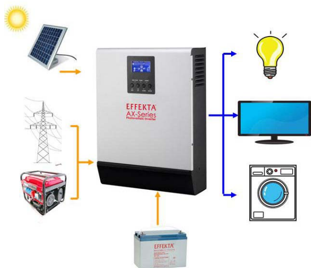
Gráfico superior: sistema de funcionamiento básico